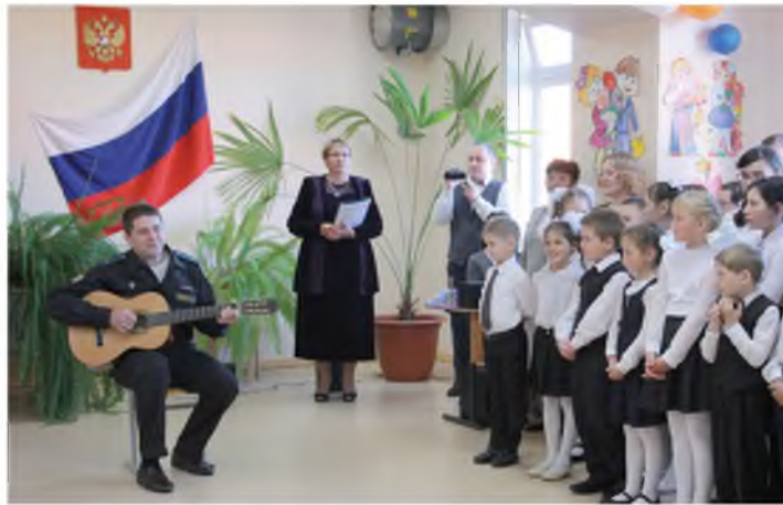
1 сентября 2017 года в Никольской школе

Как-то знакомые предложили на сцене выступить. Первый