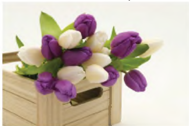
Совет клуба старожилв АМР, Члены Алеутского отделения СПР