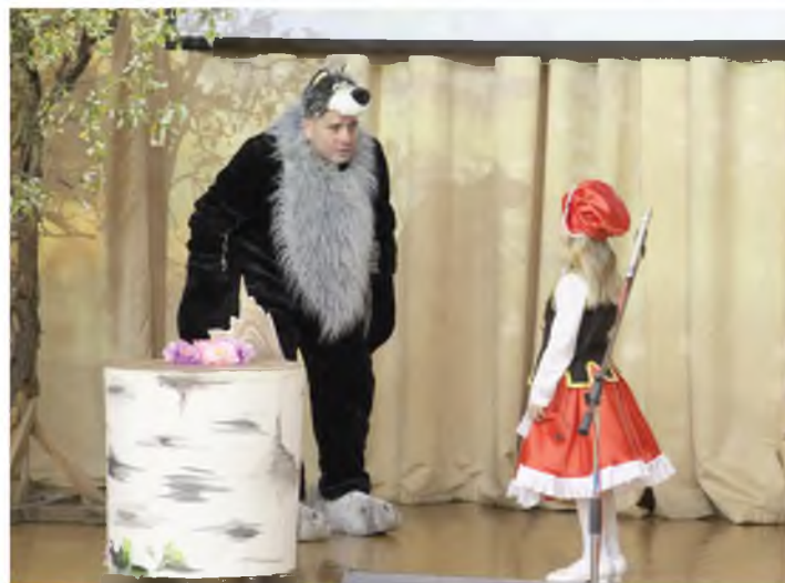
Концерт ко Дню пожилого человека