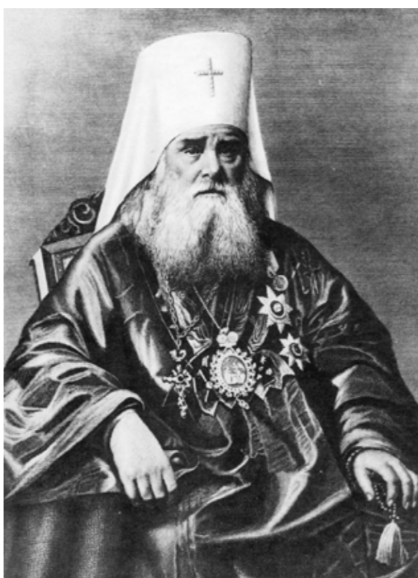
Святитель Иннокентий

Став священником, отец Иоанн в 1824 году получил от епархиального начальства письменное приглашение на миссионерское служение на Алеутские острова. Вместе с женой, тещей и детьми он отправился в семимесячное трудное путешествие из Иркутска на Северо-Восток Российской империи. Вряд ли тогда думал, соглашаясь на это предложение, что почти три десятилетия его жизни будут связаны с землей Аляской — так тогда называли Аляску. Ее открыли русские мореходы в 1732 году, когда судно «Гавриил», выйдя из Нижнекамчатска под командой геодезиста Михаила Гвоздева и штурмана Ивана Федорова, преодолев ураганные ветры и жестокие штормы Берингова моря, в последние дни августа